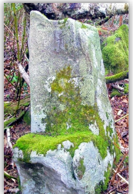
山道に残る安全祈願仏台座

●主催：北海道留萌振興局・石狩振興局 / 協力：特定非営利活動法人 増毛山道の会