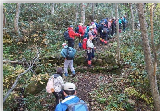
石積遺構をわたるトレッキング参加者