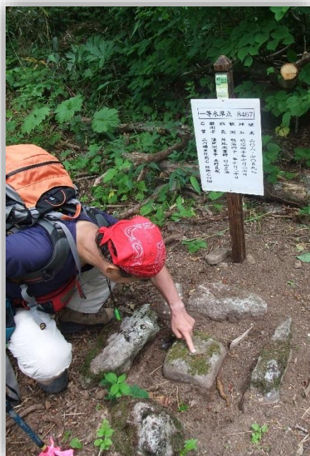
明治40年設置の一等三角点